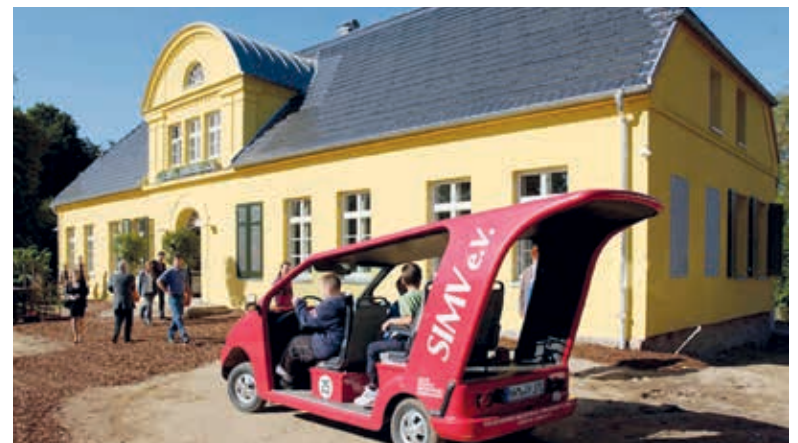
Das Gutshaus in Wietow wurde ökologisch saniert und beherbergt heute das Solarzentrum M-V als Veranstaltungsort für internationale Konferenzen, Ausstellungen oder Beratungen für Privatpersonen zum Thema "Solarenergie und ihre effektive Nutzung"