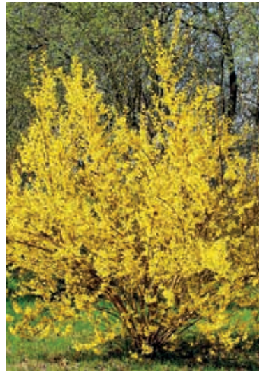
Forsythien, schöner Farbtupfer in der Natur