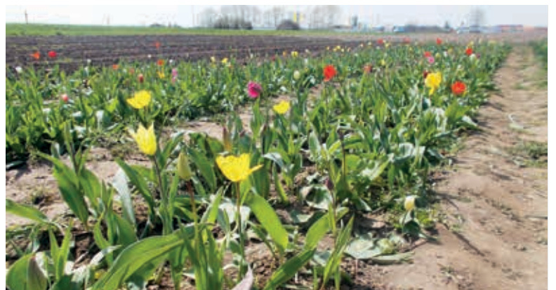
Tulpen auf dem Feld zum Selberpflücken

Liebe Leserinnen und Leser, vielen Dank für Ihre Bilder zum Thema „Frühlingserwachen in Nordwestmecklenburg“. Die schönsten Leserbeiträge haben wir hier für Sie zusammengestellt. Auch für den kommenden NORDWESTBLICK rechnen wir ganz fest mit Ihren Einsendungen. Diesmal sind wir auf der Suche nach Ihren Fotos* zum Thema „Mein Lieblingsplatz in Nordwestmecklenburg“ . Zeigen Sie uns die Plätze, Orte und Stellen im Landkreis, an denen Sie sich am liebsten erholen, entspannen oder einfach nur Kraft schöpfen. Wichtig ist, dass die Bildeinsendungen mit Namen, Kontaktdaten des Fotografen und Inhaltsangabe (Vorschlag für die Bildunterschrift) gekennzeichnet sind. Wir freuen uns sehr auf Ihre Einsendungen an presse@nordwestmecklenburg.de ! *Mit dem Einsenden von Fotos und ggf. zugehörigem Text bestätigen Sie, dass Sie Urheber des eingesandten Materials sind, keine Persönlichkeitsrechte Dritter verletzt werden und stimmen ausdrücklich einer unentgeltlichen Nutzung für alle Verwendungszwecke durch den Landkreis Nordwestmecklenburg zu.