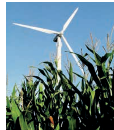
Windenergieanlagen sind allorts im Landkreis zu sehen.

Es ist aber auch ein Ersatz der direkten Beteiligung durch