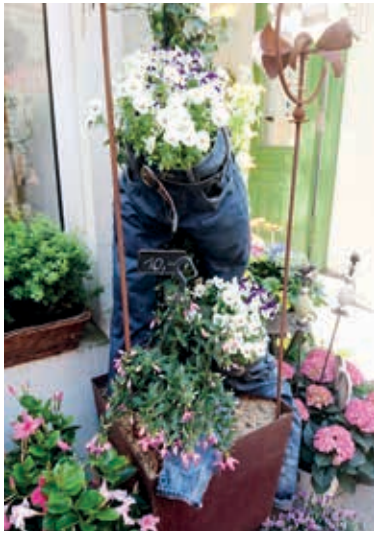
Frühlingsboten in Wismar