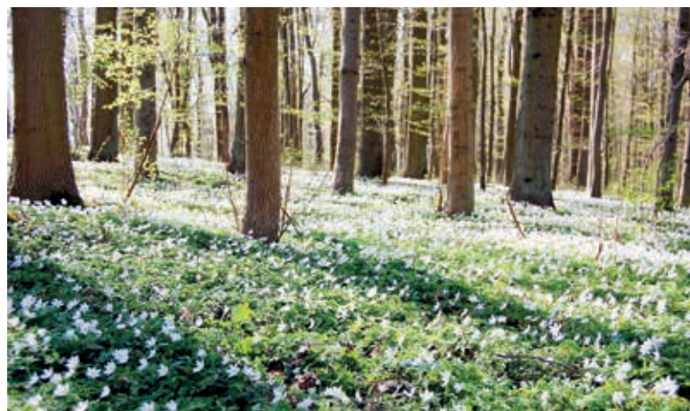
Ein Teppich aus Blüten im Wald

Liebe Leserinnen und Leser, vielen Dank für Ihre Bilder zum Thema „Frühlingserwachen in Nordwestmecklenburg“. Die schönsten Leserbeiträge haben wir hier für Sie zusammengestellt. Auch für den kommenden NORDWESTBLICK rechnen wir ganz fest mit Ihren Einsendungen. Diesmal sind wir auf der Suche nach Ihren Fotos* zum Thema „Mein Lieblingsplatz in Nordwestmecklenburg“ . Zeigen Sie uns die Plätze, Orte und Stellen im Landkreis, an denen Sie sich am liebsten erholen, entspannen oder einfach nur Kraft schöpfen. Wichtig ist, dass die Bildeinsendungen mit Namen, Kontaktdaten des Fotografen und Inhaltsangabe (Vorschlag für die Bildunterschrift) gekennzeichnet sind. Wir freuen uns sehr auf Ihre Einsendungen an presse@nordwestmecklenburg.de ! *Mit dem Einsenden von Fotos und ggf. zugehörigem Text bestätigen Sie, dass Sie Urheber des eingesandten Materials sind, keine Persönlichkeitsrechte Dritter verletzt werden und stimmen ausdrücklich einer unentgeltlichen Nutzung für alle Verwendungszwecke durch den Landkreis Nordwestmecklenburg zu.