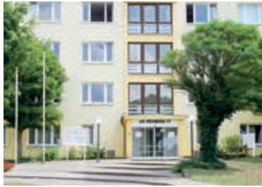
Das Verwaltungsgebäude des Amtes im Ort Dorf Mecklenburg

Durch den Zusammenschluss der ehemaligen Ämter Dorf Mecklenburg und Bad Kleinen entstand am 15. Oktober 2004 das zentral im Landkreis Nordwestmecklenburg gelegene Amt Dorf Mecklenburg – Bad Kleinen. Es grenzt im Norden an die Hansestadt Wismar und im Südosten an den Landkreis Ludwigslust-Parchim.