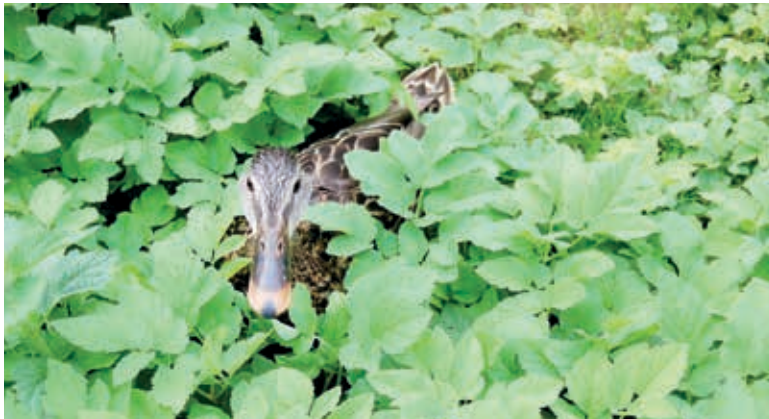
Mal schauen, ob der Frühling schon da ist!