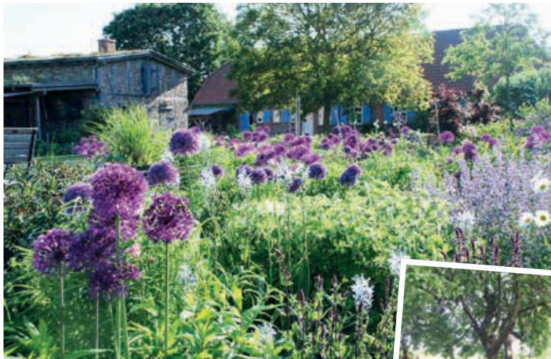
Blick in die Gärten von Drispeth und Alt Meteln (r.)

Stille und Weite in einem wild-romantischen Garten mit Einblicken in vor Ort entstandener Landschaftslyrik und Kurzprosa in Alt Meteln, viele mit Staudenbeeten umpflanzte Bäume, gemütliche Sitzcken und eine Kräuterecke direkt am Cramoner See, ein großer Naturgarten mit jungen und alten Gemüsesorten, historischen Rosen, alten Heil- und Gewürzpflanzen in Dalberg, die Gutshausgärten in Stellshagen und Parin – das sind nur fünf ausgewählte Beispiele für offene und sehenswerte Gärten in Nordwestmecklenburg anlässlich der Aktion „Offene Gärten in MV“ am 11. und 12. Juni. 129 Privatgärtner, kleine Gärtnereien, Hof-Ca-