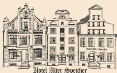
Hotel Alter Speicher

Das City Partner Historik Hotel Alter Speicher in Wismar gehört zu einem der führenden Häuser der Hansestadt Wismar. Es ist seit 1993 in Familienbesitz, privatgeführt und mit 4 Sternen klassifiziert. Neben 75 Hotelzimmern und 15 einfachen Gästehauszimmern verfügt das Hotel außerdem über ein historisches Galerie-Restaurant und Banketträume, in denen bis zu 250 Gäste bewirtet werden können. Zusätzlich verfügt es über ein kleines Schwesterhaus mit 13 Zimmern, ebenfalls in der UNESCO-Welterbe-Altstadt gelegen.