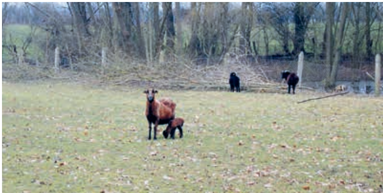
Erste Frühlingsboten