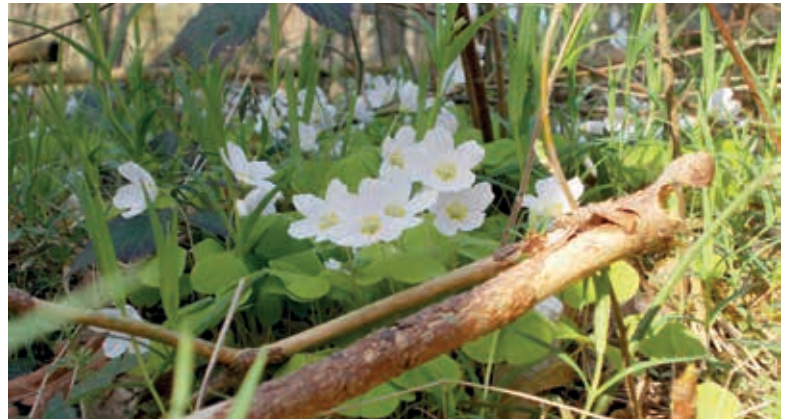
Die ersten zarten Waldblüten