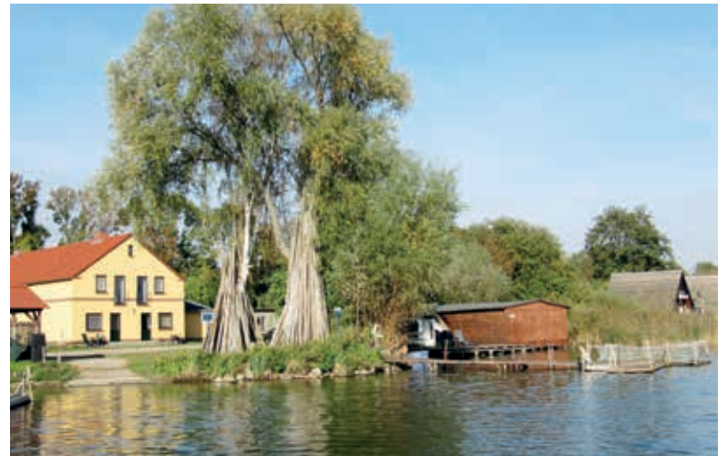
Die Fischerei Prignitz in Hohen Viecheln hat eine lange Tradition. Der Ort am Nordufer des Schweriner Sees ist ein beliebtes Ausflugsziel für Tagesgäste und Urlauber