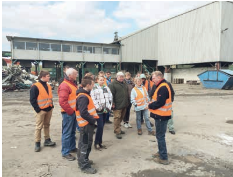
Im Recyclingpark Degtow bei Grevesmühlen

Etwa 260 km Kreisstraßen und 50 km Radwege standen für das Projekt und die gemeinsamen Teams zur Verfügung.