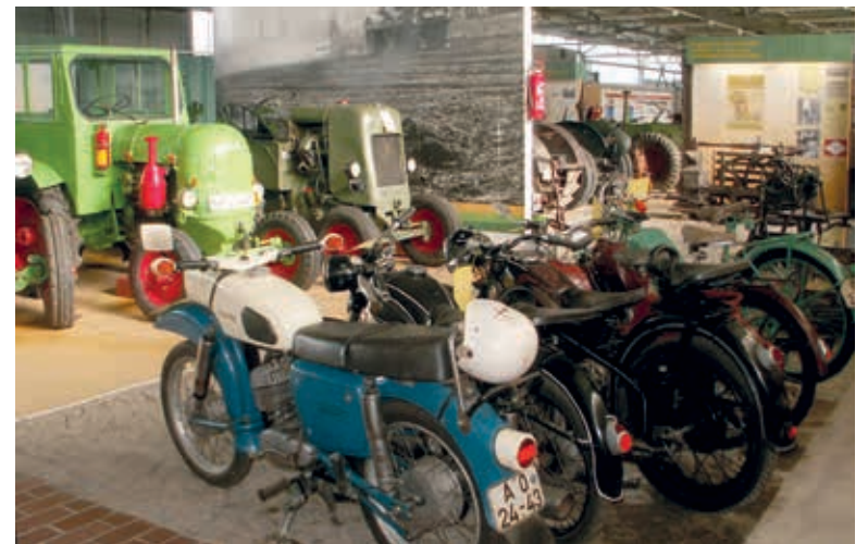
Das Kreisagrarmuseum Dorf Mecklenburg ist einmalig in Mecklenburg-Vorpommern. Die 2011 komplett neu gestaltete Dauerausstellung zeigt sehr anschaulich die Historie der ländlichen Entwicklung. Im Freigelände findet ein Teil der umfangreichen Agrartechniksammlung Platz. Das Museum bietet zusätzlich saisonale Veranstaltungen wie z.B. Schlachtfest, Garten- und Töpfermarkt oder Oldtimertreffen an