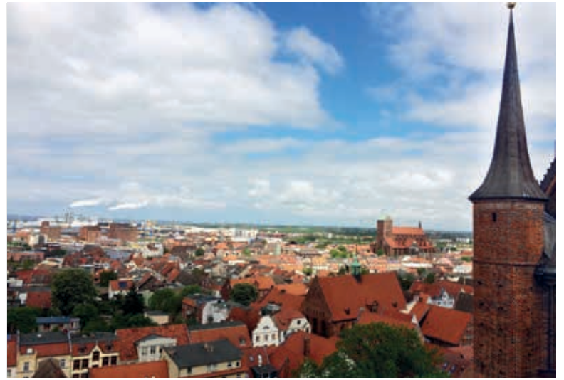
Blick von der St.-Georgen-Kirche auf Wismar im Frühling