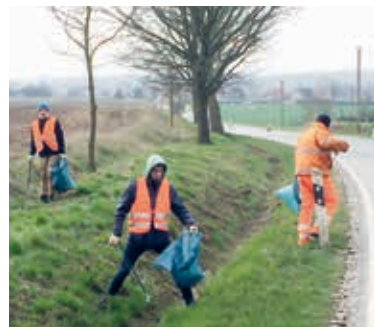
Beim Müllsammeln an der Kreisstraße 21 bei Beidendorf

Insgesamt wurden 145 km Kreisstraßen und einige Kilometer Rad-