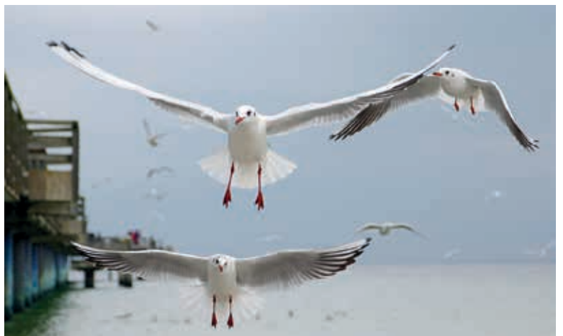
Möwen am Strand von Boltenhagen