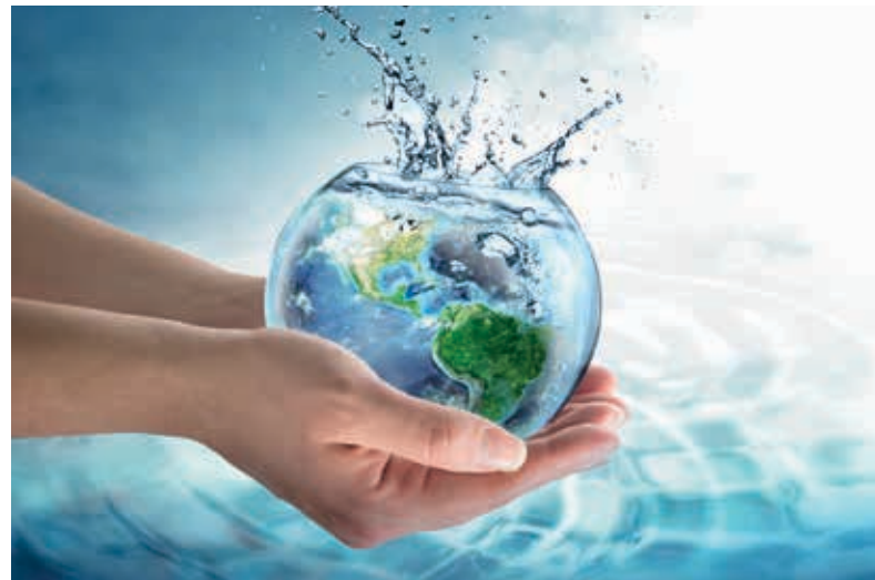
Ein Arbeitsbereich von Molinaris: Innovative Lösungen zur Nutzung von Energie durch Wärmerückgewinnung aus Abwasser.

Bei uns ist die Ausbildung zur Bürokauffrau/Bürokaufmann und Dachdecker Geselle/in möglich. Wir bewerten die Bewerber ausschließ-