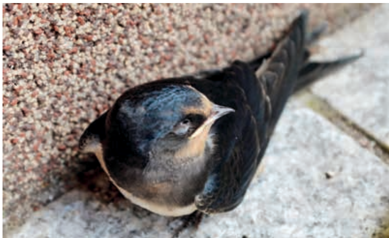
Überraschender Besuch auf der Terrasse

Liebe Leserinnen und Leser, wir wünschen Ihnen allen ein gesundes, erfolgreiches Jahr 2018! Bedanken wollen wir uns ganz herzlich für die vielen Einsendungen und tollen Fotos im letzten Jahr. Wir freuen uns über weiteren Austausch und darüber, Ihnen in dieser Ausgabe Impressionen zum Thema „Jahresrückblick“ abzudrucken. Und mit Ausblick auf die bereits eingetretene „Winterzeit“ freuen wir uns auf weiteres Bildmaterial für die Februar-Ausgabe. Warm eingekleidete Spaziergänger, bereifte Blätter, gedimmtes Licht und frostige Flächen... Senden Sie Ihre Fotos dazu bis zum 2. Februar an unsere Redaktion. Wir rechnen wieder ganz fest mit Ihren Bildern zum Mitmachen und Mitgestalten. Wichtig ist, dass die Bildeinsendungen mit Namen, Kontaktdaten des Fotografen und Inhaltsangabe (Vorschlag für die Bildunterschrift) gekennzeichnet sind. Wir freuen uns sehr auf Ihre Einsendungen an presse@nordwestmecklenburg.de