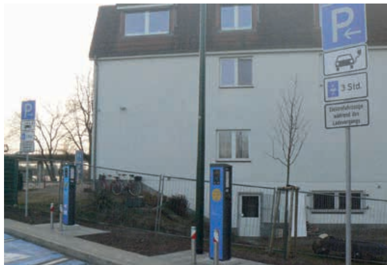
Zwei neue Stromtankstellen befinden sich jetzt auf dem kreiseigenen Parkplatz in Wismar, Rostocker Straße 67.

„Wir kennen die Vorteile der Elektromobilität wie z.B. die CO 2 Reduzierung und die Verringerung des Verkehrslärms. Vor diesem Hintergrund hat der Landkreis im November drei E-Autos vom Typ BMW i3 für den kreiseigenen Fuhrpark angeschafft. Damit möchten wir als öffentliche Verwaltung mit gutem Beispiel vorangehen, auch wenn es nur ein vergleichsweise kleiner Schritt ist. Doch ganz von allein fahren die E-Autos bekanntlich nicht. Das heißt, wir brauchen ein Netz von Ladestationen. Eine Elektro-