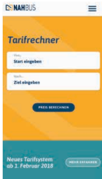
Anhand des kostenlosen Tarifrechners ist die Tarifzone und Preisstufe, mit der Eingabe von Start- und Zieladresse, leicht und schnell ermittelt

NAHBUS Nordwestmecklenburg GmbH Wismarsche Straße 155 D-23936 Grevesmühlen Telefon: 03881 788810 Telefax: 03881 788816 E-Mail: info@nahbus.de