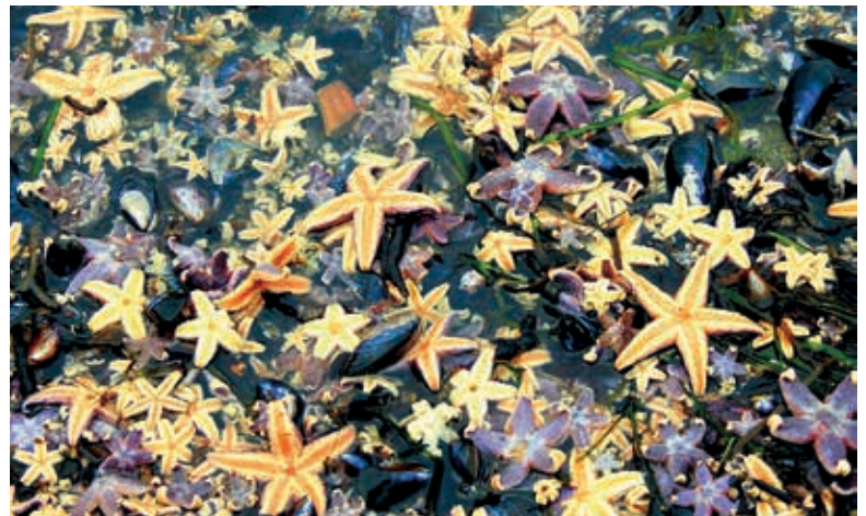
Sturmpopfer wurden zigtausende Seesterne nach dem Oktobersturm