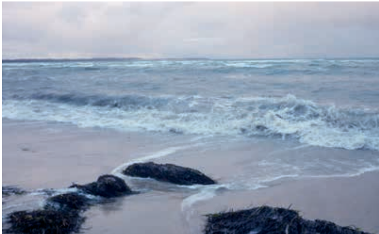
Sturm an der Wohlenberger Wieck Januar 2017