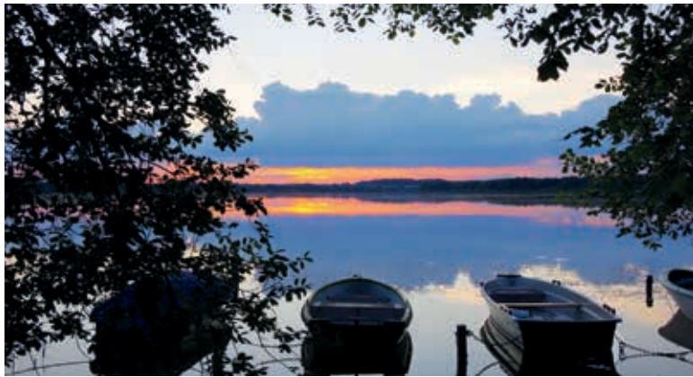
Sonnenuntergang am Mechower See