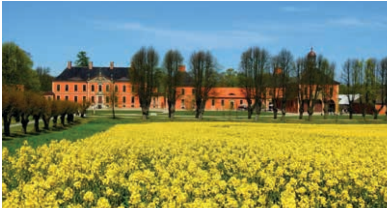
Eine farbenfrohe Traumkulisse im Frühsommer ist das Schloss Bothmer in Klütz