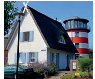
Blaue Wieck