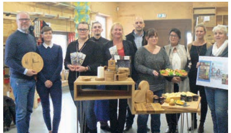
Sie alle präsentieren unsere Region ab 19. Januar auf der Grünen Woche in Berlin und sind bereits gut darauf eingestimmt...

Fahrten zur Grünen Woche in Berlin bieten Oppermann-Reisen aus Klütz am 24. Januar (Telefon: 038825/22612) sowie Krohn-Busreisen aus Grevesmühlen am 20., 24. und 28. Januar (Telefon: 08881/7565101 an).