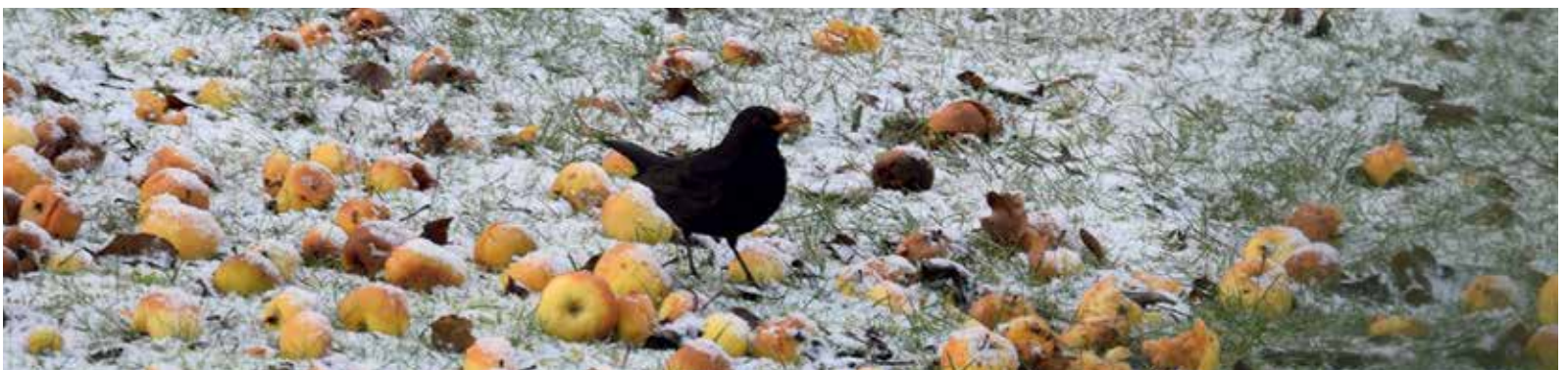
Vitaminreicher Futterplatz für die Amsel