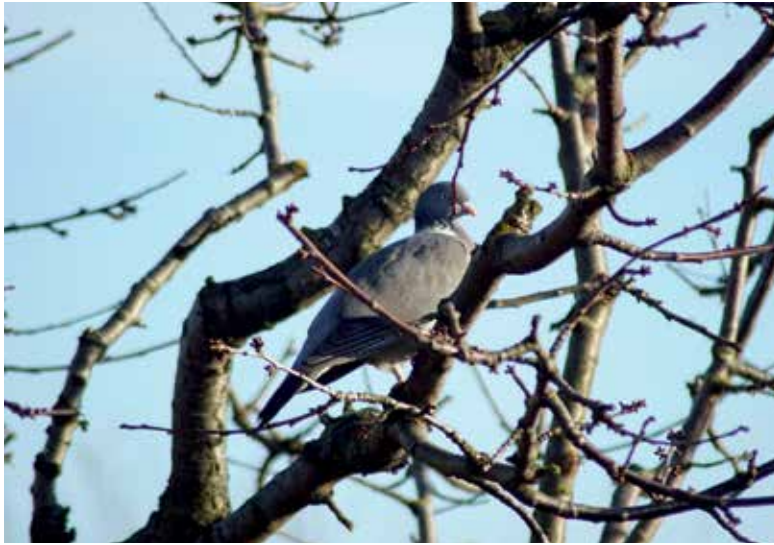
Taube im Wintergarten