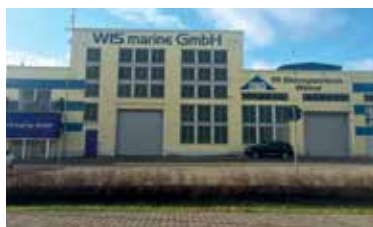
Der Firmensitz am Wismarer Westhafen

Derzeit sind wir über 50 Mitarbeiter und agieren zudem mit ausländischen Partnerfirmen, um die vielfältigen Projekte zu bewältigen. Neben Technikern und Ingenieuren arbeiten bei uns Monteure in den Gewerken: