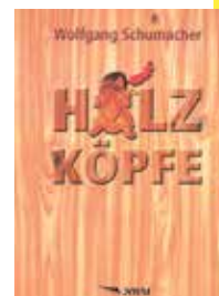
Die Publikationen EigenArt1 und Holzköpfe erschienen im NWM-Verlag/2000 und 2004