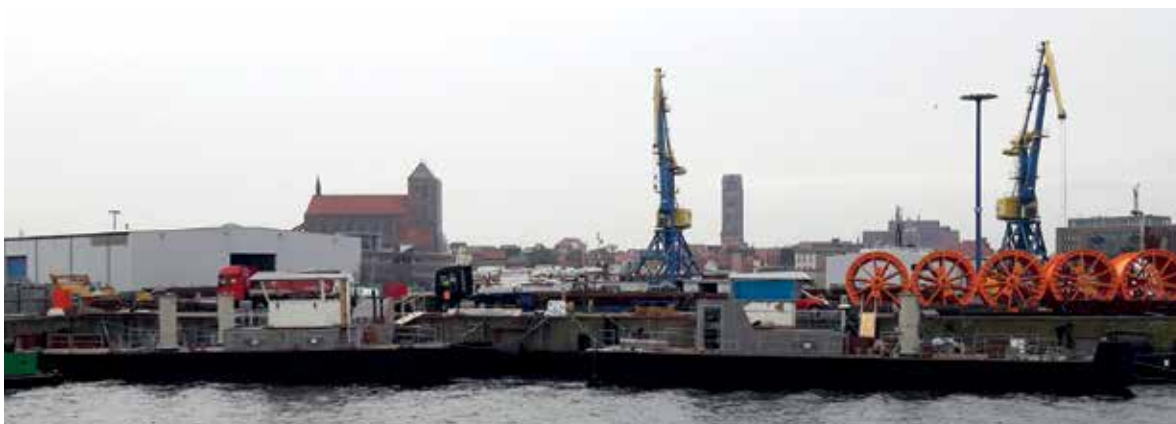
Sicht auf zwei im Bau befindliche Mehrzweckarbeitsschiffe vor der Wismarer Skyline.

Durch die Mitarbeit an Forschungsthemen haben wir ein großes Netzwerk geknüpft und uns eine breite Kompetenz angeeignet. Diese nutzen wir in diversen Großprojekten wie die Ausrüstung von Offshore-Plattformen und Stena-Fähren. Auch am Bau der AIDA-Serie auf der Meyer Werft waren wir maßgeblich beteiligt im Bereich Ausbau. Seit 2010 treten wir als Werft auf und realisieren Aufträge wie Doppelhüllentanker, Arbeits- und Flussschiffe für deutsche Wasserstraßen- und Schifffahrtsämter. Besonders stolz sind wir auf den Isolierauftrag zum Bau des weltgrößten Passagierschiffes. Es gibt kaum Projekte für Schiffsneubauten in Deutschland, an denen wir nicht beteiligt werden. Wir arbeiten daran, unser Alleinstellungsmerkmal als maritimer Systemlieferant in der Region und deutschlandweit auszubauen. Wir möchten ein attraktiver Arbeitgeber sein, der auch in Zukunft ein kompetenter Partner für maritime Aufgaben ist.