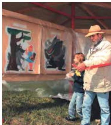
Die Bratwurst im Märchen/Holzhausen

Neben dem gesellschaftlichen und kulturellen Engagement ist das künstlerische Schaffen des „Billermokers“ zu würdigen. Unzählige Ausstellungen zeigen seine Holzbildnisse zu den bevorzugten Themen Maritimes, Natur, Bauernhäuser, Tiere und Erotik.