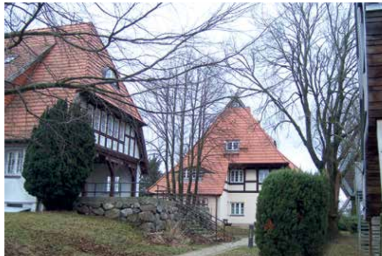
Blick auf die denkmalgeschützten Häuser der ehemaligen Jugendherberge Beckerwitz

Ein Besichtigungstermin findet am 15. Februar von 9 bis 12 Uhr statt. Weitere Termine können vereinbart werden.