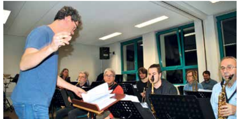
NDR Bigband – Musiker Ingo Lahme, er spielt Posaune und Tuba, probt mit der Big Band der Kreismusikschule in Grevesmühlen im Rahmen der Schultour für ein gemeinsames Konzert.

Übrigens ist die NDR-Bigband aus Hamburg während ihrer Schultour „School's Out – It's Bigband Time“ auch bei der Big Band Wismar der Kreismusikschule zu Gast und es gibt am 19. Februar um 19.30 Uhr ein Konzert im Theater Wismar.