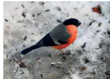
Gimpel o. Dompfaff