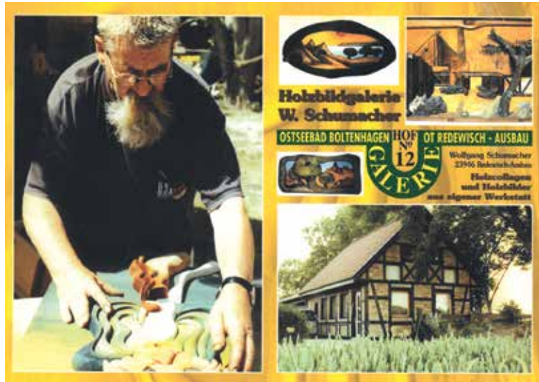
Postkarte der Holzbildgalerie in Redewisch-Ausbau

Die Arbeit des Beirates wird nach dem Brand seines Wohnhauses beendet. Gleichzeitig steht die Bil-