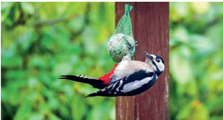
Auch für den Buntspecht ist genug Futter da