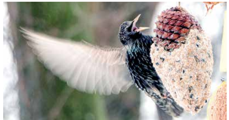
Hier bin ich der Star!