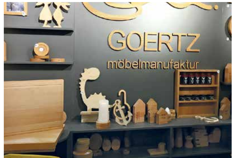
Der Stand der Möbelmanufaktur Goertz aus Wismar.