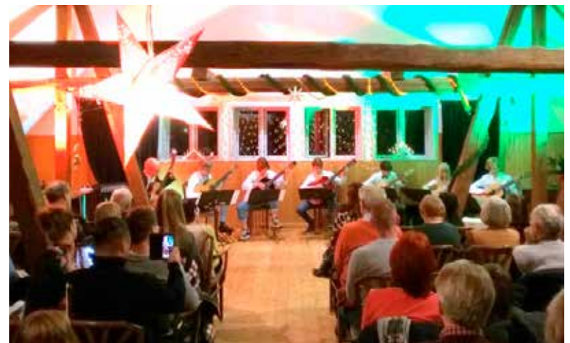
Das Weihnachtskonzert der Kreismusikschule in Neukloster.