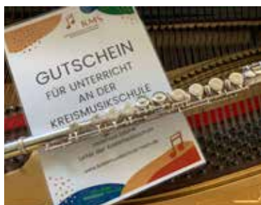
Persönlicher Gutschein für ein besonderes Weihnachtsgeschenk.

Eintritt: normal 15 € erm. 10 € Gruppen 6 €