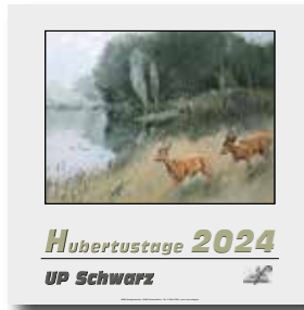
Auflage: 500 Ex., 12 Monatsblätter, Handschrift, Preis: 15,00 EURO