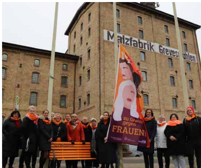
Die Teilnehmenden der Aktion vor der Malzfabrik in Grevesmühlen.