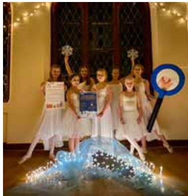
Die Tanzschülerinnen präsentieren Requisiten für die Weihnachtskonzerte und das Weihnachtsmärchen.