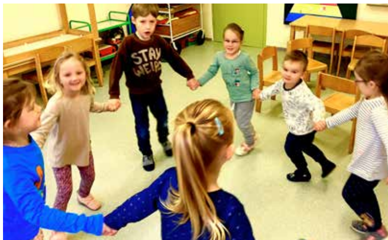
Die Kinder der Kita Carlow üben für den Weihnachtswichteltanz.