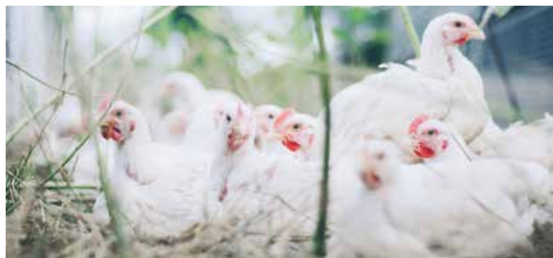
Neuen Ausbrüchen vorbeugen

Am 21.11.2023 wurde in einer Putenhaltung mit ca. 25.000 Mastputen in der Gemeinde Lewitzrand im Landkreis Ludwigslust-Parchim der Ausbruch der Geflügelpest vom Subtyp H5N1 amtlich festgestellt.