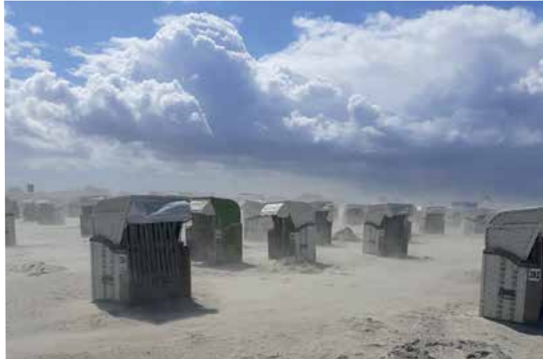
Katrin Dahl • Sturm am Norddeich an der Nordsee

Mit dem Einsenden von Fotos bestätigen Sie, dass Sie der Urheber des eingesandten Materials sind, keine Persönlichkeitsrechte Dritter verletzt werden und stimmen ausdrücklich einer unentgeltlichen Nutzung für alle Verwendungszwecke durch den Landkreis Nordwestmecklenburg zu.