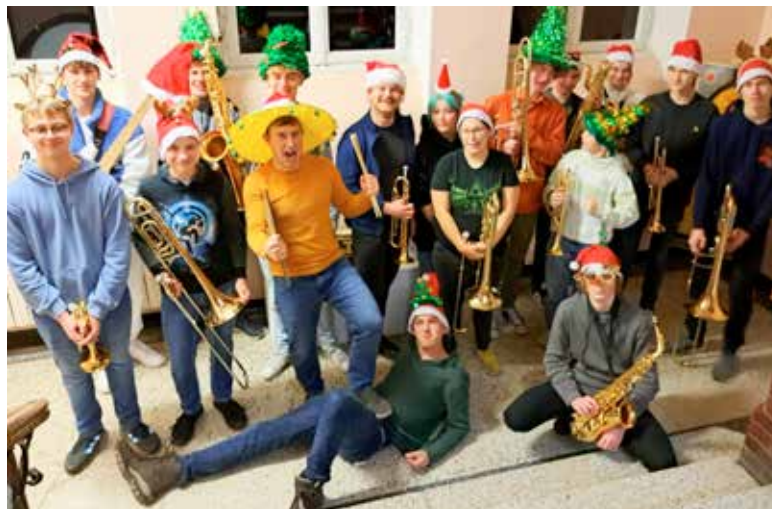
Gute Stimmung bei der Big Band der Kreismusikschule während der Proben für das Jahresabschlusskonzert.

Kartenvorverkauf unter Tourist-Information 03841-19433 oder www.eventim.de Kita- und Schulgruppen 03841-32604-0