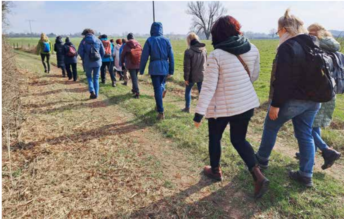
20 Frauen beteiligten sich an der Frauenwanderung in Rehna