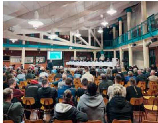
Auf der Informationsveranstaltung am 14. März in Gadebusch konnte der Landkreis die Bürgerinnen und Bürger im direkten Austausch informieren. Landkreis Nordwestmecklenburg

einen Betreiber betreut. Dieser entwickelt auch ein Angebot für Beschäftigung und Integration. Der Landkreis Nordwestmecklenburg steht jederzeit für alle Fragen und Anliegen – sowohl der Asylsuchenden, als auch den Bürgerinnen und Bürgern – zur Verfügung.