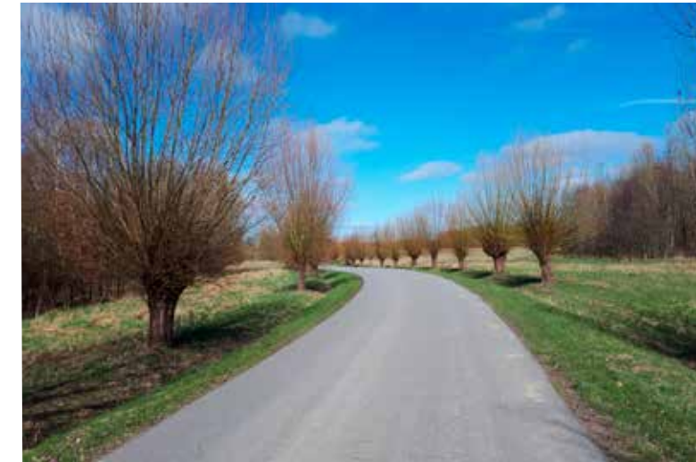
Bernd Klose • Frühlingserwachen

Mit dem Einsenden von Fotos bestätigen Sie, dass Sie der Urheber der eingesandten Materials sind, keine Persönlichkeitsrechte Dritter verletzt werden und stimmen ausdrücklich einer unentgeltlichen Nutzung für alle Verwendungszwecke durch den Landkreis Nordwestmecklenburg zu.