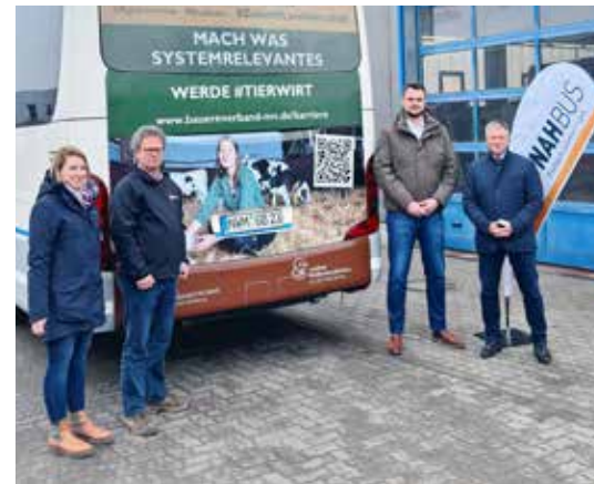
Drei Busse von NAHBUS mit der „Landwirtschaft“-Werbung fahren jetzt durch Nordwestmecklenburg.

Für Fragen rund um eine Ausbildung in den „Grünen Berufen“ steht der Kreisbauernverband Nordwestmecklenburg auf den Jobmessen „vocatium“ in Schwerin am 16. und 17.04.2024 in