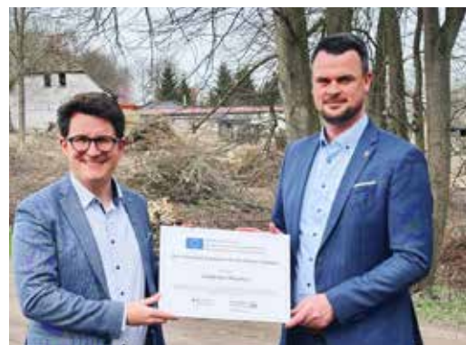
Landrat Tino Schomann (re.) übergab den Zuwendungsbetrag an Boltenhagens Bürgermeister Raphael Wardecki.

Die Entwässerung des Weges erfolgt über vorhandene Mulden und Gräben. Im Zuge der Bauarbeiten wird das vorhandene Grabensystem beräumt und neu profiliert.